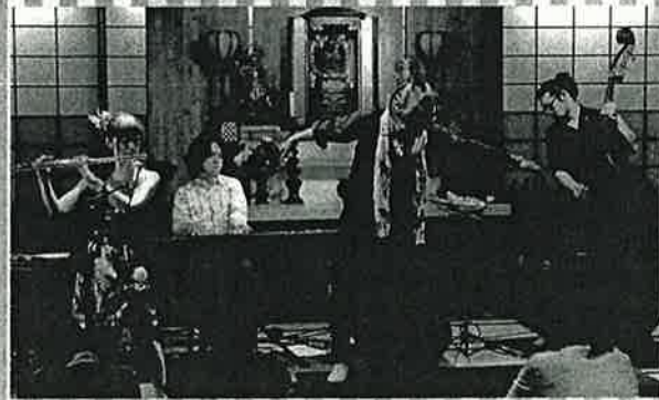
2018年、タップ&ジャズでこころおどる年明けに!