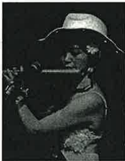
フルート IZUMI (長崎県出身)