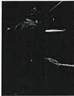
ピアノ 竹内 大輔